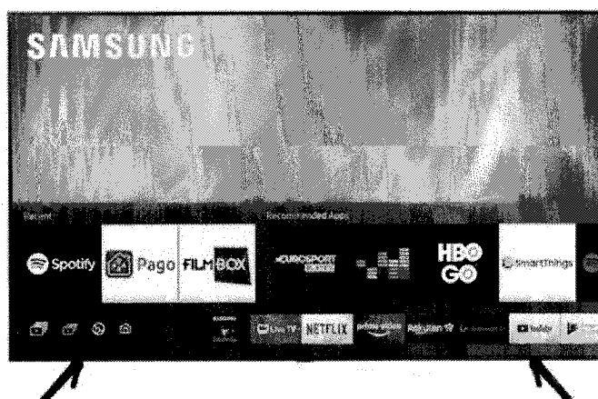
Figura 3 Imagine orientativă Televizor minim 163 cm